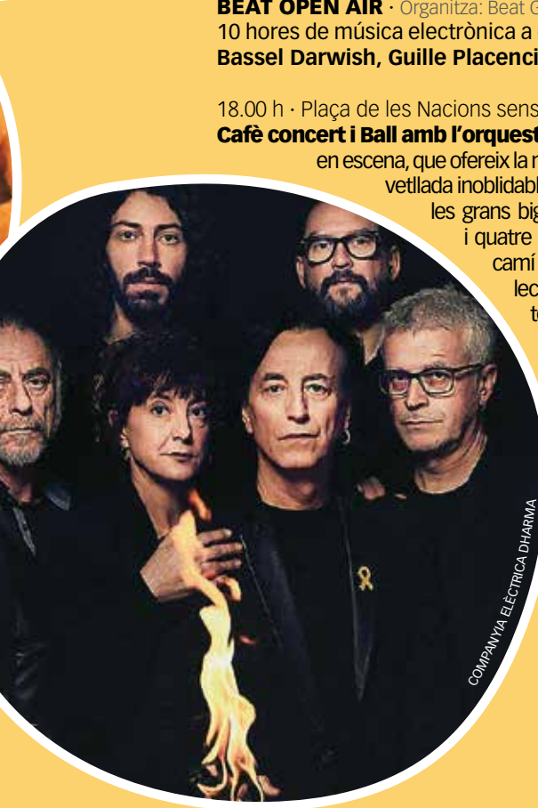
COMPANYIA ELÈCTRICA DHARMA